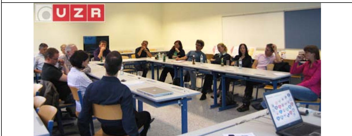
Bei der Diskussion